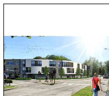
appartement gelijkvloers 3 bus 2 OPPERVLAKTEN