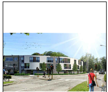
appartement 2e verdieping 5 bus 5 OPPERVLAKTEN