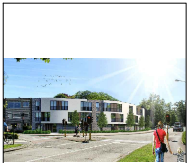
appartement gelijkvloers 1 bus 2 OPPERVLAKTEN